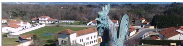
Le coq du clocher, en arrière-plan quelques constructions du Bourg.

Rubrique Nature avec Natura 2000 ou encore la vie des Associations et tous les bulletins municipaux depuis 2014. La consultation est recommandée à tous ! A noter sur les réseaux sociaux le film de 1960 relatant l'inauguration de la stèle de Rapine a été vu par plus de 1000 visiteurs et celle sur le Bourg (extrait ci-dessus) par près de 400.