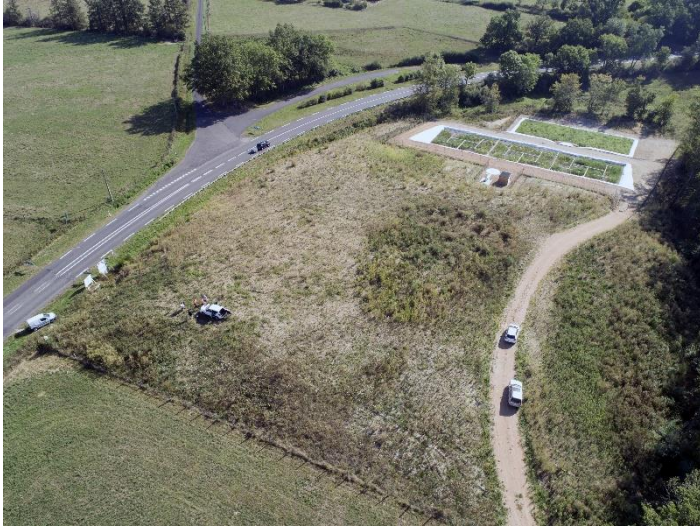
La station d'épuration et ses deux bassins vus de haut, à gauche la RD 2089 et l'embranchement pour La Mothe.

Ainsi le Bourg, le Foyer pourront être desservis quelques semaines après ce travail très particulier le fonçage c'est-à-dire glisser sous la voie ferrée à plus de 3m50 de profondeur un tuyau de 25cm de diamètre où coulera l'eau usée pour rejoindre la station d'épuration.